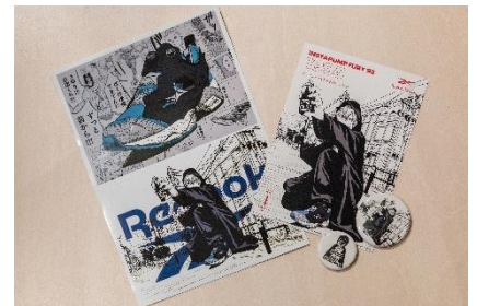
▲左からステッカー・缶バッジ