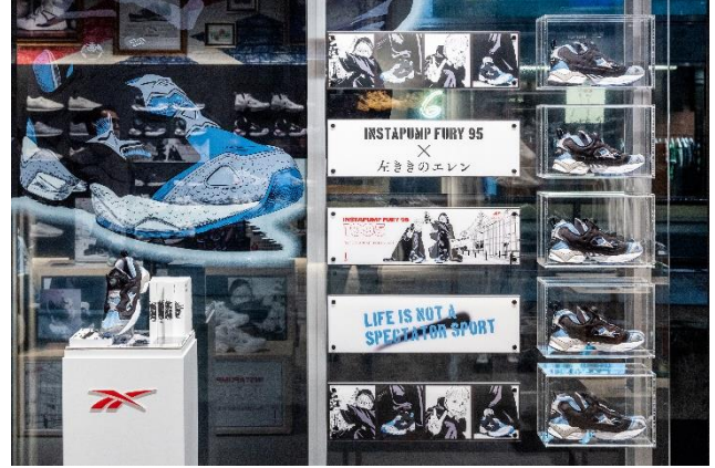
▲リーボック クラシックストア原宿店 内装