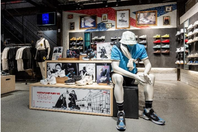
▲リーボック クラシックストア原宿店 内装

今回のコラボレーションでは、キャンペーンと同日発表となる、リーボックの代表モデルである「INSTAPUMP FURY 95」の“サックスブルー”の発売を記念し、かっぴー先生による完全描き下ろしの巨大ウィンドウアートや、原作と連動したストーリーのオリジナル漫画がリーボック クラシックストア原宿店、リーボック公式 Twitter にて公開します。さらに、リーボックストア クラシックストア原宿店、リーボックストア渋谷店を『左ききのエレン』がジャック！原宿店の巨大ウィンドウアートだけでなく、各店内にも『左ききのエレン』の漫画やグラフィックが施され、漫画の世界観にどっぷり浸れること間違いなしです。