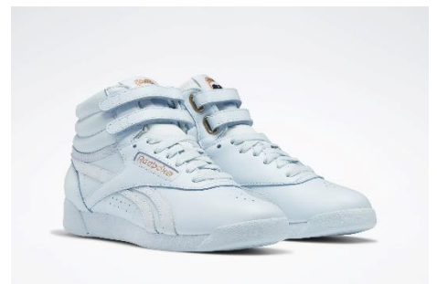
名称：CARDI B F/S HI (カーディ・B フリースタイル ハイ)