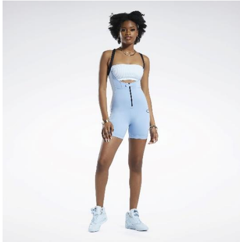
名称：RBK CARDI LEOTARD 2-in-1 (リーボック カーディ レオタード 2-in-1)