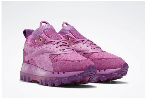
名称：CLASSIC LEATHER CARDI V2 (クラシックレザー カーディ V2)