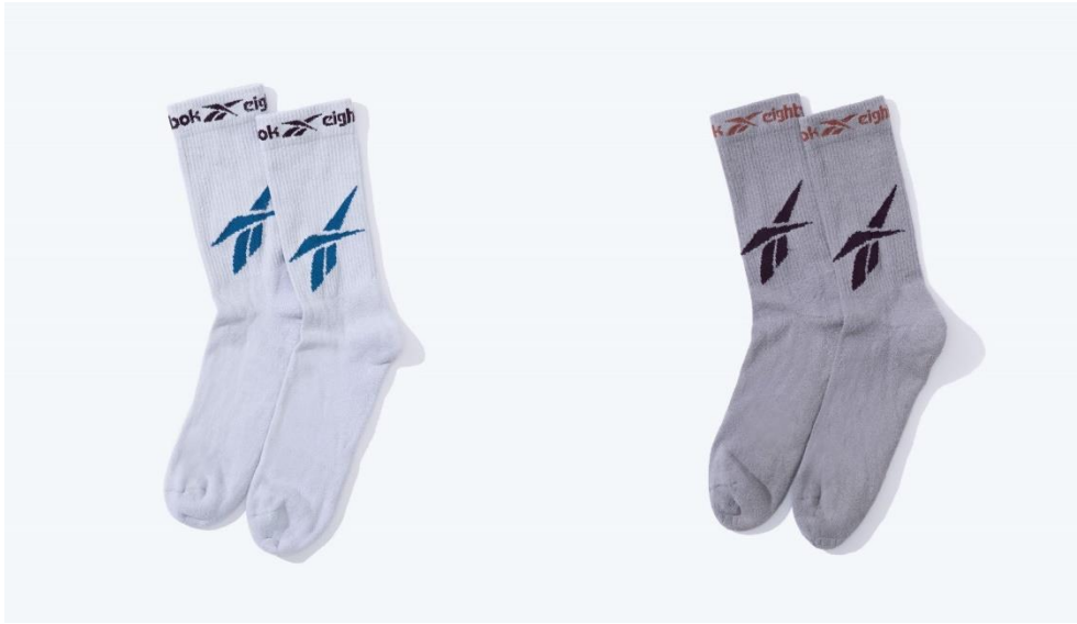
名称： 81 SOCK (81 ソックス)