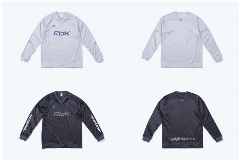
名称： 81 LS TEE (81 ロングスリーブ T シャツ)