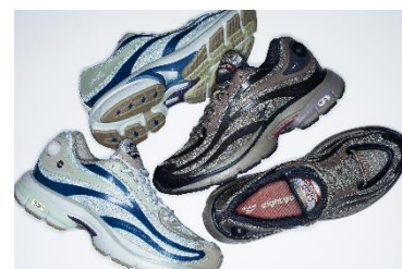
▲PREMIER PUMP PARIS