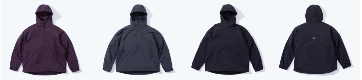
名称： 81 WOVEN ANORAK (81 ウーブン アノラック)