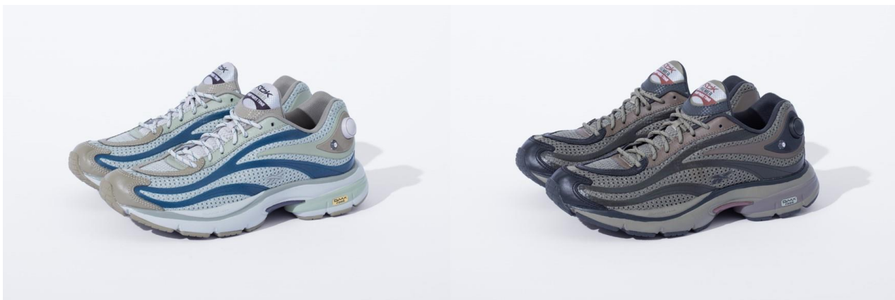
名称： PREMIER PUMP PARIS (プレミア ポンプ パリス)