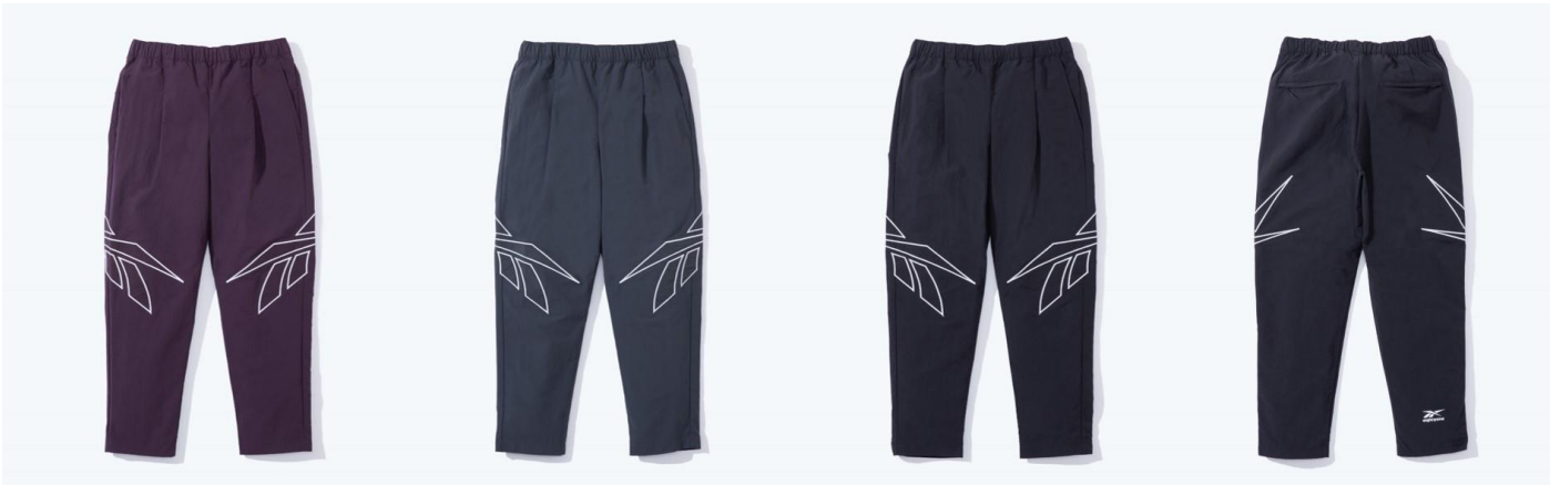
名称： 81 WOVEN PT (81 ウーブン パンツ)