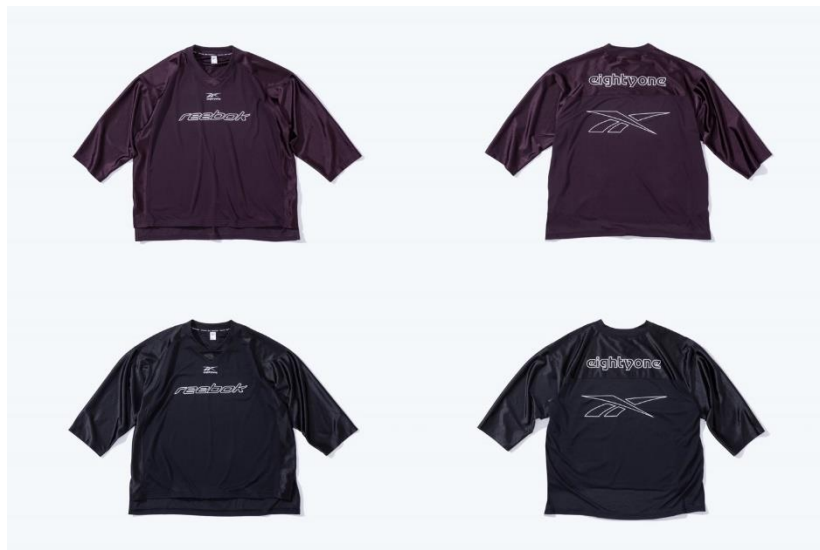
名称： 81 TEE 2 (81 T シャツ 2)