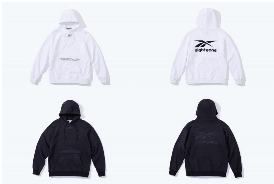
名称： 81 HOODIE (81 フーディ)