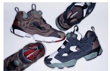
▲81 INSTAPUMP FURY

今回は、本コレクションにおいて初登場となるリーボックを代表するモデル「INSTAPUMP FURY」に加え、かつてリーボックが競技スポーツ用ウェアを展開していた当時のサッカーシャツから着想を得たアイテムなど、注目アイテムが多数登場します。また、2月に発売されたジャケットとセットアップとして使用できる同素材のハーフパンツや、鮮やかなカラーリングの半袖 T シャツなど、これから暖くなる季節にぴったりのアイテムにも注目です。