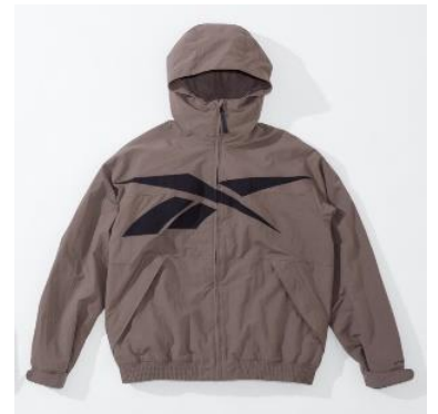
▲2月発売「81 WOVEN JKT」