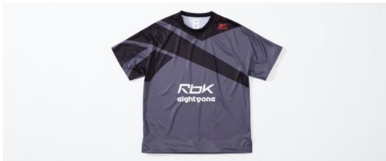
名称： 81 SOCCER Tee (81 サッカー T シャツ)

過去にリーボックが展開していたサッカーシャツから着想を得てデザインされた半袖Tシャツは、正面に2000年代前半に使用されていたリーボックのロゴ「Rbk」をプリントし、左肩部分には「Reebok eightyone」のコレクションロゴを刺しゅうし、スポーティなデザインに仕上げられています。