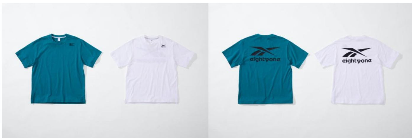
名称： 81 Tee (81 Tシャツ)

シーンを選ぶことなく使用できる半袖Tシャツは、背面にあしらわれたマット調のロゴプリントや、スリットが施された裾など、シンプルデザインの中にもさりげないこだわりが光るデザインに仕上げました。全ラインナップの中でターコイズブルーなど、唯一明るいカラーを採用しており、コーディネートアクセントとしてもお楽しみいただけます。