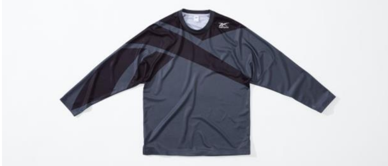
名称： 81 LS Tee (81 ロングスリーブ T シャツ)

かつてリーボックが、競技スポーツウェアをラインナップしていた頃に展開していたサッカーシャツから着想を得てデザインされたTシャツです。7分丈でスポーティな素材が快適な着心地を生む、こだわりの1着となっています。