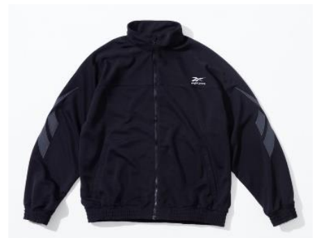
▲2月発売「81 JERSEY JKT」