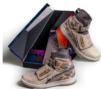
▲プレミアム「ステルス」型パッケージ

本モデルは、ドロップシップと海兵隊のユニフォームにインスパイアされた、実際に手にした人だけが楽しめる、細部にまでこだわりぬいたデザインとなっています。全体的にイエローとブラックのコントラストを強調し、映画の世界観をそのまま表現することで、『エイリアン』ファンも満足するようなこだわりが多く施されています。また、本モデルが梱包されるシューズボックスは、ドロップシップにインスパイアされた特別なプレミアム「ステルス」型パッケージで、ブラックのホログラフィックを施したユニークな3Dデザインボックスです。カモフラージュ・テクノロジー印刷により、映画『エイリアン』の近未来感を巧みに表現しています。