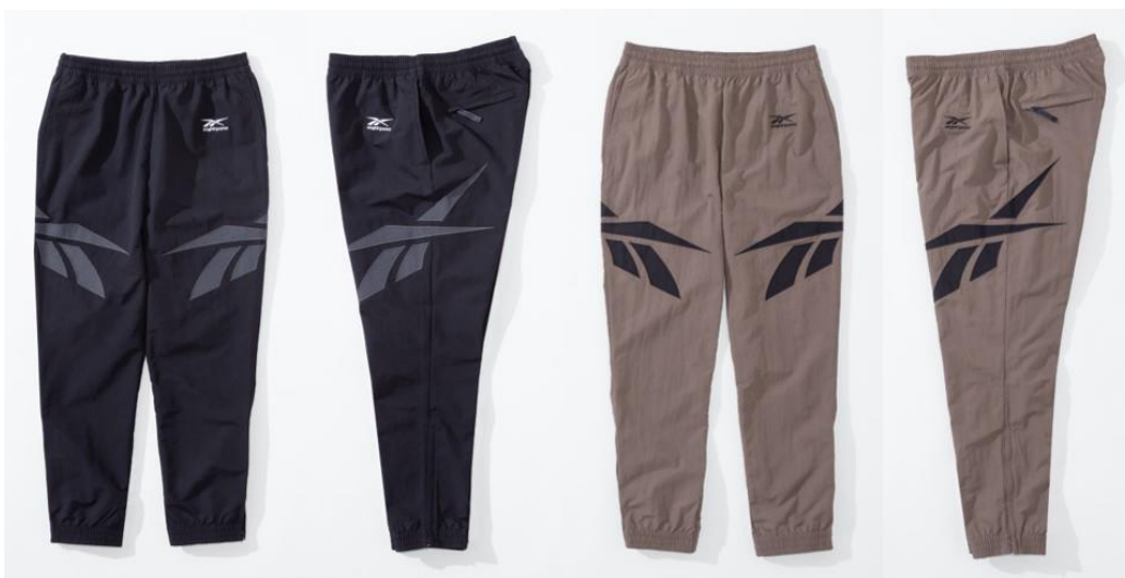
名称： 81 WOVEN PT (81 ウーブン パンツ)

ジャケットと同素材で、セットアップでお使いいただけるアイテムです。足首からシューズにかけて美しく見えるよう、テーパードを効かせたシルエットに仕上がっています。両サイドに施された大胆なベクターロゴがアクセントとなっています。