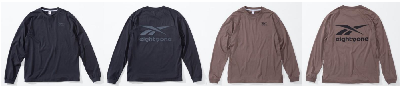
名称： 81 LS Tee (81 ロングスリーブ T シャツ)

年間を通してお使いいただける薄手のロングスリーブ T シャツです。背面のマット調のプリントやスリットが施された裾など、シンプルなデザインの中にもさりげないこだわりが光るアイテムです。