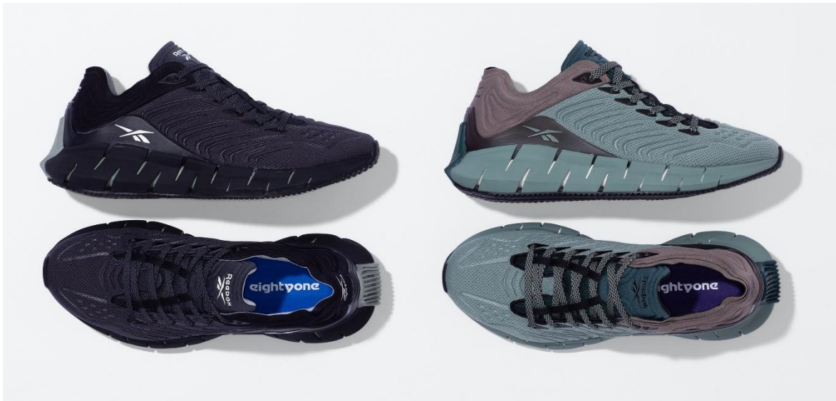
名称 : 81 ZIG KINETICA (81 ジグ キネティカ)

【2 月ローンチ商品詳細】 ※3 月以降発売予定商品の詳細情報は、順次公開します。