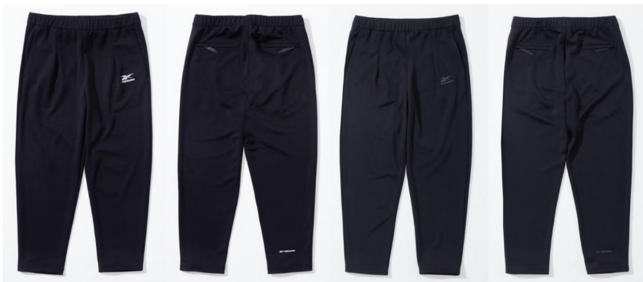
名称： 81 JERSEY PT (81 ジャージ パンツ)

ジャージ素材同士のセットアップでお使いいただけるパンツです。腰から太ももにかけて、ジャージのパンツとしては珍しい、タックが施されているなど、一工夫のこだわりが上質さを引き立てます（右写真参照）。