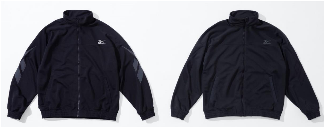
名称： 81 JERSEY JKT (81 ジャージ ジャケット)

ジャージ素材でゆったりとしたシルエットに仕上がったフルジップタイプのモデルです。両袖にボディとは別素材でベクターロゴが施されており、ポケットの縁などにも異素材を組み合わせることで、全体の立体感を創出しています。