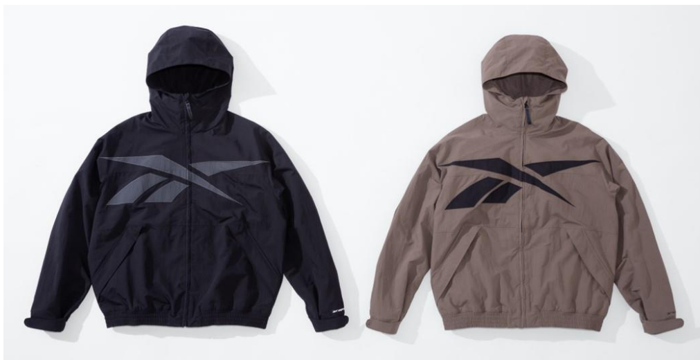
名称： 81 WOVEN JKT (81 ウーブン ジャケット)

リーボックのアーカイブにはないオリジナルシルエットのジャケットです。前面にはリーボックを代表するベクターロゴを大胆に配置し、背中にはアクセントとしてコラボレーションロゴの刺繍が施されています。同じポリエステル素材でも、ボディとベクターの部分で生地を薄くし、素材の使い方や縫合などによって、シンプルながらも立体感を演出。また、ジップの内側の風防をはじめ、ゴムで圧着された引き手のタグなど、従来のリーボックのアパレルには見られないこだわりが細部に見られます。リーボックらしさを残しつつ、VAINL ARCHIVEらしいディテールで仕上げられた、よりファッション性の高いアイテムです。