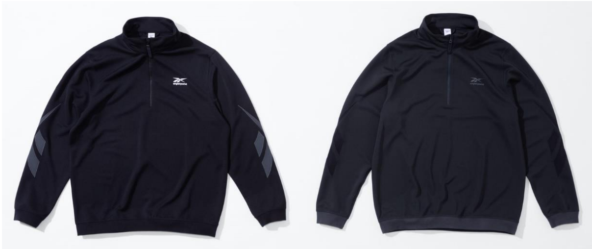
名称： 81 JERSEY CT (81 ハーフジップ ジャージ ジャケット)

ジャージ素材のハーフジップタイプのトップスです。袖口や裾部分にも異素材を組み合わせた上質なアイテムに仕上がっています。