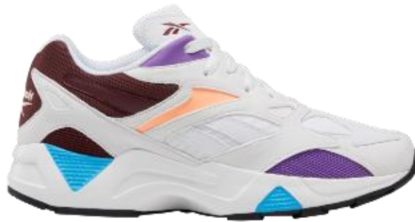
名称： AZTREK 96 (アズトレック 96)