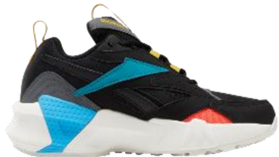
名称： AZTREK DOUBLE (アズトレック ダブル)