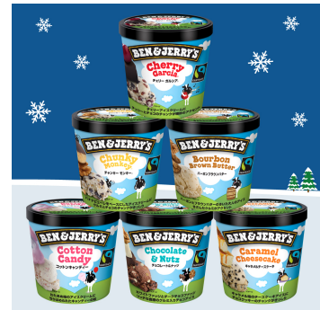
チャンキーセレクション 6個セット

【仕様】 オリジナルボックスに6個セッティング (スプーン&ドライアイス1.5kg)