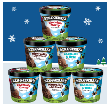
チョコレートセレクション 6個セット

【仕様】 オリジナルボックスに6個セッティング (スプーン&ドライアイス1.5kg)