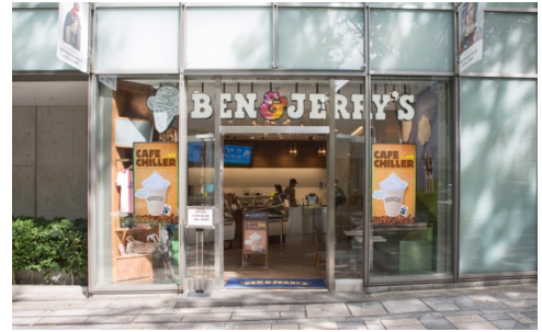
上：表参道ヒルズ スクープショップ

アメリカ・バーモント州で生まれたスーパープレミアムアイスクリーム「ベン&ジェリーズ」は、1978年、アイスクリームが大好きな2人の青年ベンとジェリーが、ガソリンスタンド跡地に開いた小さなお店から始まりました。ゴロゴロしたチャンク（チョコレートやクッキーの具）が入ったユニークなアイスクリームはたくさんの人を虜にし、現在は世界37か国*で展開しています。日本では 旗艦店「表参道ヒルズ店」、「ららぽーと豊洲店」、期間限定ショップ「エキマルシェ大阪店」の全3店舗で営業中。関東エリアの一部の高級食料品店や一部のスーパーとコンビニにつづき、関西エリアでも2016年3月からミニカップアイスクリームの販売を開始。店舗は順次拡大中。お店と同じおいしさを、ご家庭でも楽しんでいただけます。