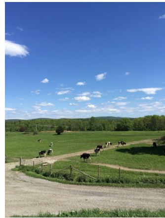
上：バーモント州にあるベン&ジェリーズの契約酪農場

ベン&ジェリーズでは創業以来、「ビジネスには、そこで得たものを社会に還元する責任がある」という考えのもと、単に利益の一部を社会貢献活動に使うということではなく、ビジネス自体が社会に貢献するものになるよう、事業を展開しています。たとえば砂糖やバニラ、ココアなどの原材料は世界中の生産者と適正な価格で取引しており、アイスクリームとして日本で初めての「国際フェアトレード認証」を受けています。またおいしく安心なミルクのため、牛にも地球にもハッピーな持続可能な酪農法を牧場の人たちと協働で行っています。大切にしているのは「社会のためになることを、楽しい方法で行う」こと。これからもさまざまな楽しい取り組みによって、世の中をよりよくなる、おいしいアイスクリームをみなさまにお届けしていきます。