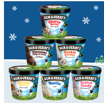
人気セレクション 6個セット

【仕様】 オリジナルボックスに6個セッティング (スプーン&ドライアイス1.5kg)