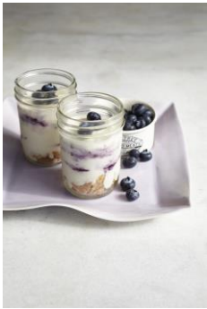
ブルーベリーレアチーズケーキ