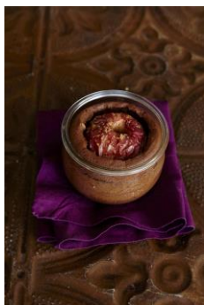
まるごとりんごのガトーショコラ

クリーミーなケーキやムースも型崩れすることなく持ち運びできる！ 友達の手土産に、ママ友の集まりに、ピクニックにも最適！