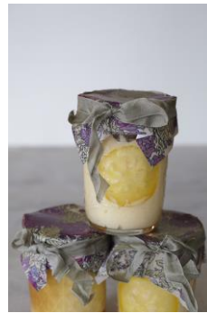
レモンチーズケーキ

密閉できて、酸化、匂いうつり、色うつりにくい特性があるので、通常のケーキと比べて4~5日の長期保存が可能！