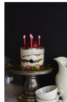
フルーツレイヤーパースデーケーキ

耐熱性の高いジャーであればオーブンで焼いてもOK。器だけでなく焼き型を兼ねているので、便利かつ経済的！