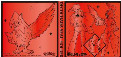
【前半・A賞】（ムクホークデザイン）