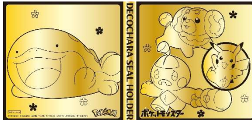
【前半・B賞】（ドオーデザイン）