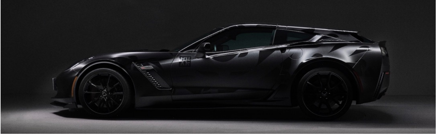
③ 「Callaway Aerowagen (Chevrolet Corvette C7)」 art work by MHAK