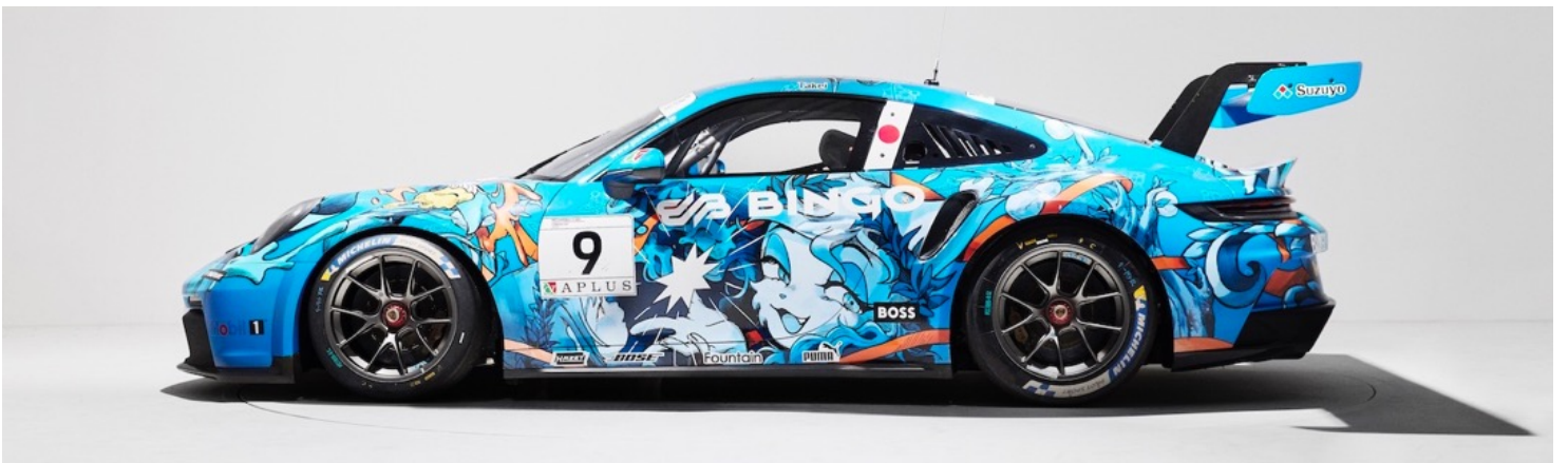
④ 「Porsche 911 GT3 Cup (type 992)」 art work by Panjan

1981 年會津若松生まれ。ペインター / アーティスト。デザイナーズ家具や内装空間に多大な影響を受けたことから絵画をインテリアの一部として捉えた”生活空間との共存”をテーマに壁画を中心とした制作活動を行う。adidas や YONEX、THE NORTH FACE 等といったグローバル企業やストリートブランドへのアートワークの提供も行い、2017 年に adidas Skateboarding とのコラボレーションで自身の名前が冠されたシグニチャーシューズを含んだコレクションをグローバルで発表、大きな話題を呼んだ。