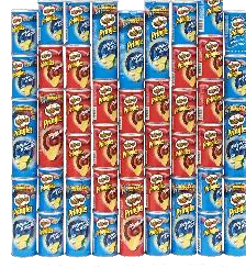
#プリングルズハート