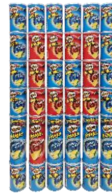
#プリングルズ文字