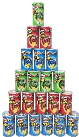
#プリングルズピラミッド

プリングルズをたくさん集めたら、こんなこともできちゃいます。チャレンジしたらSNSにアップしてみて！