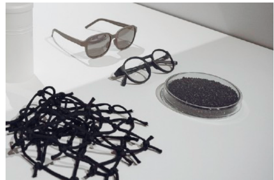
Hibang | 友漁循環眼鏡 RE-fishing-Net Circular Eyewear

過去に3年連続出展したテキスタイルブランド「印花染 inBloom」は、本展を通じて、日本の代理店を開拓し、数多くの受注に繋がっただけでなく、初の直営店を蔵前にオープンさせるなどの販路拡大を実現しました。他ブランドもギャラリーやショップでの販売に繋げるなど、毎回着実に日本での知名度を高める機会となっています。初出展となるのは、「HAPPYMT (カスタマイズ文房具)」、「Entadar (PPUレザー製バッグ)」、「物 WOO Collective (錫細工雑貨)」、「本・冶鐵 Hon Casting (鑄造技術による生活雑貨)」、「軟水泥石生活實驗室 (独自の開発材料を用いた家具、雑貨)」、「Hibang (アイウェア)」、「緑藤生機 (美容製品)」の7ブランドです (*次ページ参照)。日本のグッドデザイン賞、レッド・ドット・デザイン賞、iFデザイン賞など国際的なデザイン賞を受賞した製品を含む実力派商品をご覧ください。