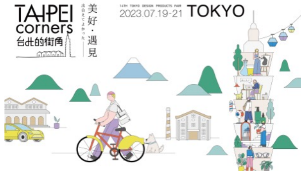
台北創意生活館 (TAIPEI corners) メインビジュアル

台北市では、デザインとテクノロジーをユーザー体験と結びつける業界の垣根を超えた取組みに力を入れており、今回は文化路徑有限公司 (Cultural Path Company Limited) と連携し、本企画初ARを取り入れた展示により、来場者はスムーズに製品情報にアクセスすることができます。また、スペース内にARで出現させる台湾を代表するランドマーク「台北101」、「台北市藝場館」にもご注目ください。