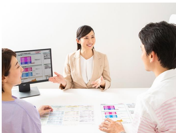
初めての方でも安心。分からないことや気になること、何でもお聞かせください。

(全国 204 店舗、関西地区で 22 店舗、兵庫県で 10 店舗 2019 年 9 月 27 日時点)