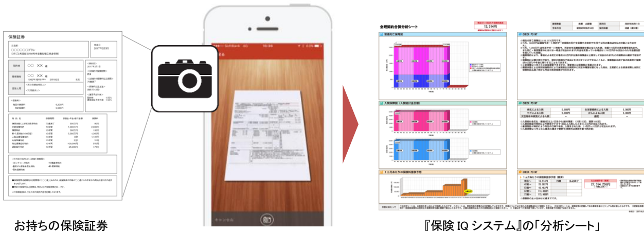
お持ちの保険証券

※1 生命保険証券 1 枚の分析に、通常 60 分かかるところを 5 分で入力の場合