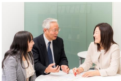
生命保険だけでなく損害保険のご相談も承っております。