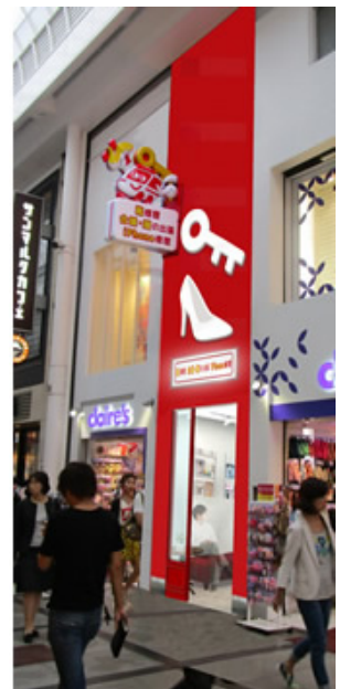
店舗アクセスマップ