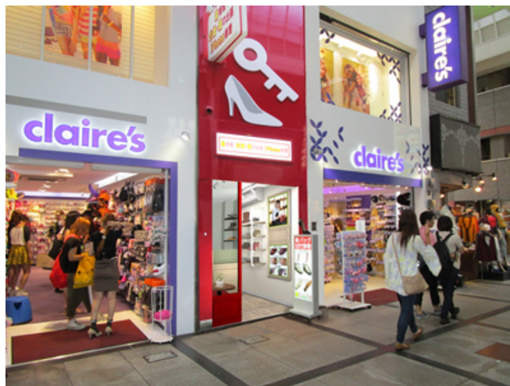
「鍵・靴・iPhone修理レスキュー 難波戎橋店」外観イメージ

お財布に優しいから嬉しい、女性や初めての方にも気軽に入れる、そんなコンビニ感覚のお店づくりを目指したマルチリペアショップが、なんばの地元に誕生します。合カギ1本280円～（製作時間3分～）、ピンヒール修理1,000円～（修理時間5分～）、iPhone修理4,800円～（修理時間30分～）など、お手頃価格のリペアメニューが揃っており、お昼休みや仕事帰りにちょっと立ち寄って、スピード修理してくれる便利なお店です。