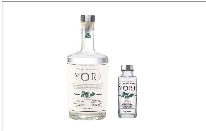
社会課題解決型サステナブルジン “YORI” 新商品『KASHIWANOHA』のボトルイメージ

クラフトジンを作る過程や、売る過程を街がプロデュースしていけるといった商品特性を活かし、廃棄されるはずだった素材を新しく生まれ変わらせ、地域経済の循環にも貢献していきます。