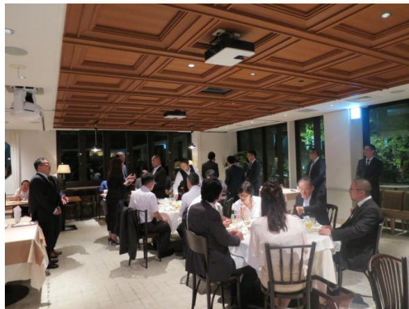
第二回「区分所有オフィス」オーナー懇親会の様子