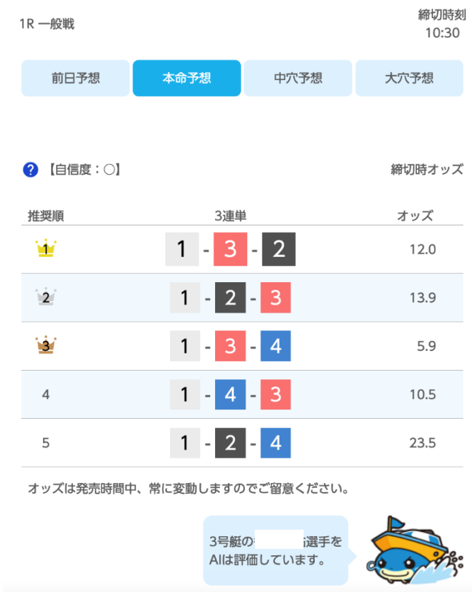
AIによる総合評価(本命予想) 1R

また、レース当日の気象情報などの追加情報を元に、各レースの開始前に3連単について「本命予想」「中穴予想」「大穴予想」の3種類を提供いたします。また、「選手特性」「モーター特性」などそれぞれの算出根拠をグラフ化し、AIが何に基づいてその選手を評価をしているのか、できるだけわかりやすくご提供することを目指しています。