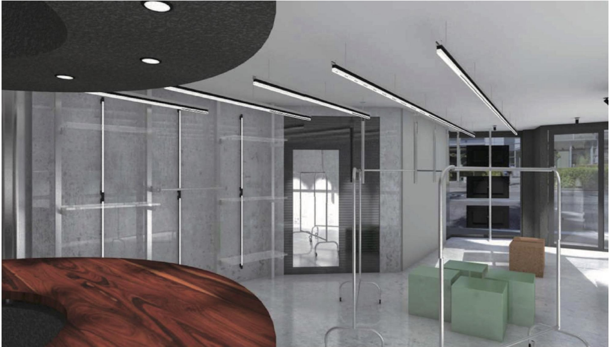
「ビームス 原宿 アネックス」の店舗すべてを使った「FUTURE ARCHIVE」のプレゼンテーション