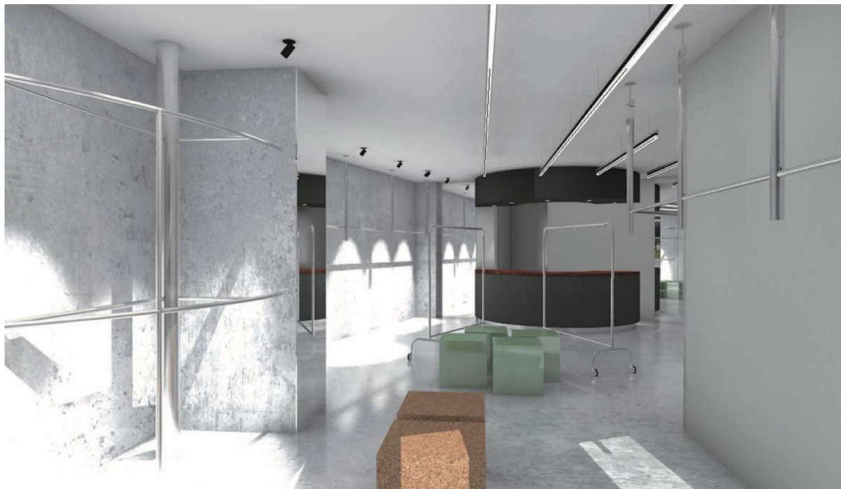
「ビームス 原宿 アネックス」の店舗すべてを使った「FUTURE ARCHIVE」のプレゼンテーション

株式会社ビームス(本社:東京都渋谷区、代表取締役社長:設楽洋)は、メンズカジュアルレーベル<BEAMS>の新拠点「ビームス 原宿 アネックス」を7月28日(金)にオープンさせ、同店舗にて、20代の若手スタッフが主導し、独自のコミュニティやネットワークを反映させた継続プロジェクト「 FUTURE ARCHIVE 」のプレゼンテーションを開始することも発表します。