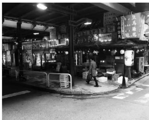
I WANT TO SEE THIS MODERN WORLD. TOKYO PHOTOS BY MIKE MILLS Fri 2 - Wed 7 June, 2017 TOKYO CULTUART by BEAMS