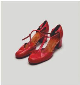
20TH CENTURY WOMEN

コラボレーションアイテムのTシャツとトートバッグに加え、限定ポスター(全8種類 各 ¥8,000+税)とサウンドトラックCD( ¥2,400+税)も販売します。