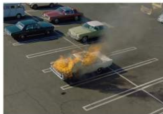
20TH CENTURY WOMEN