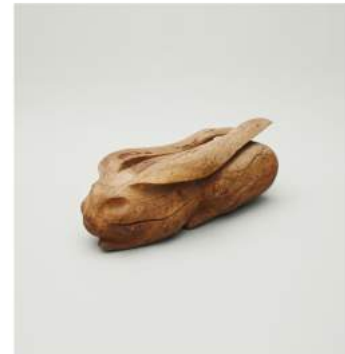
20TH CENTURY WOMEN