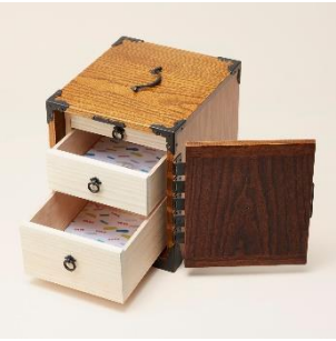
越前筆筒：筆筒 価格：500,000 円（税別）