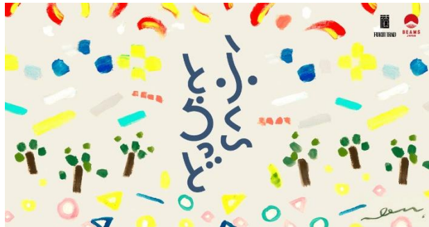
のんさんデザイン