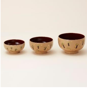
越前漆器：三つ組み椀 価格：25,000 円（税別）