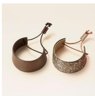
越前焼：バングル 価格：8,500 円（税別）