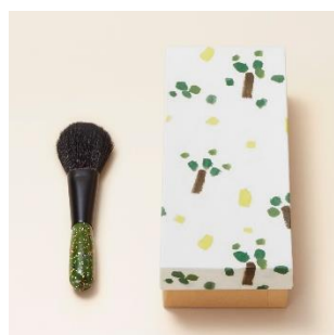
若狭塗：ファンデーションブラシ 価格：130,000 円（税別）