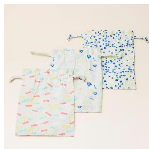
越前和紙：巾着ポーチ 価格：3,800 円（税別）