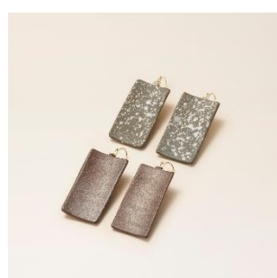
越前焼：ピアス 価格：5,500 円（税別）