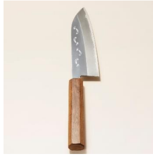
越前打刃物：包丁 価格：22,000 円（税別）