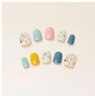
越前漆器：ネイルチップ 価格：7,000 円（税別）