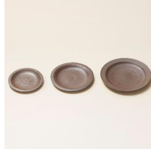
越前焼：薄作平皿 価格：7,000 円（税別）