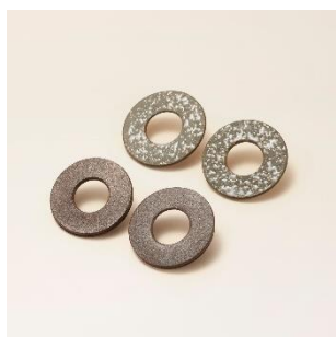
越前焼：ピアス 価格：7,000 円（税別）