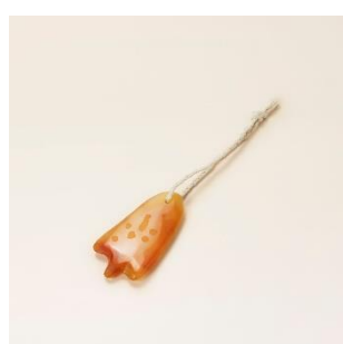
若狭めのう細工：かさ 価格：11,000 円（税別）