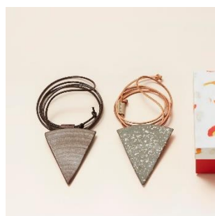
越前焼：ピザネックレス 価格：6,500 円（税別）