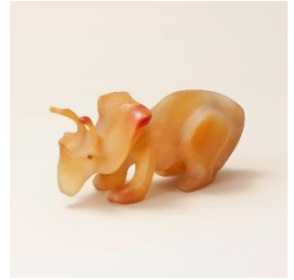
若狭めのう細工：恐竜の置物 ※参考展示