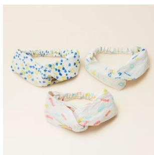
越前和紙：ヘアバンド 価格：3,700 円（税別）