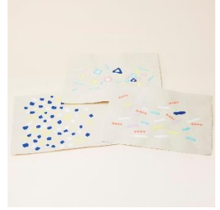
越前和紙：和紙アート 価格：10,000 円（税別）