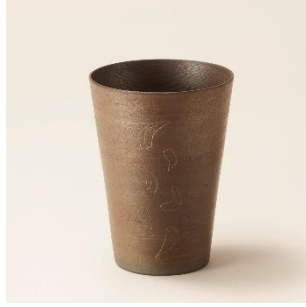
越前焼：薄作フrieriカップ 価格：3,000 円（税別）