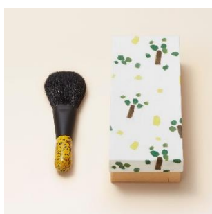
若狭塗：ファンデーションブラシ 価格：155,000 円（税別）