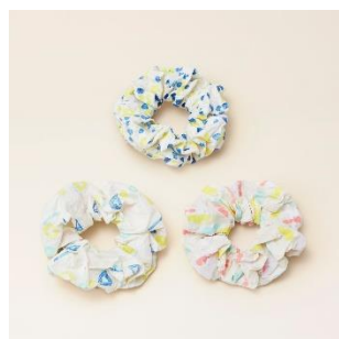
越前和紙：シュシュ 価格：2,000 円（税別）