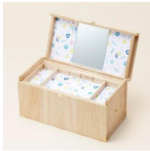
越前筆筒：コスメボックス 価格：135,000 円（税別）