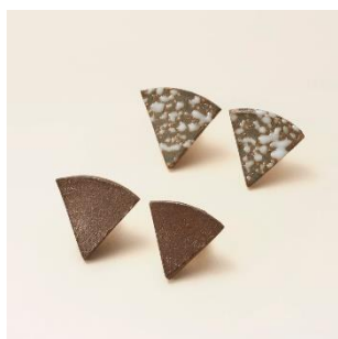
越前焼：ピアス 価格：5,000 円（税別）