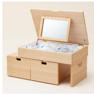
越前筆筒：マルチデスク 価格：115,000 円（税別）