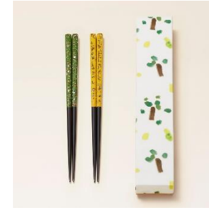
若狭塗：塗箸 価格：15,000 円（税別）