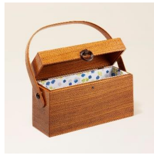
越前筆筒：ハンドバッグ 価格：100,000 円（税別）