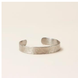
越前打刃物：バングル 価格：12,000 円（税別）