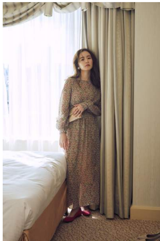
Dress 27,000yen + Tax / JOIÉVE Bag 13,000yen + Tax / GIANNI CHIARINI