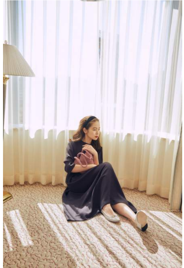
Dress 28,000yen + Tax / Demi-Luxe BEAMS Bag 35,000yen + Tax / MEHRY MU Shoes 45,000yen + Tax / REPETTO