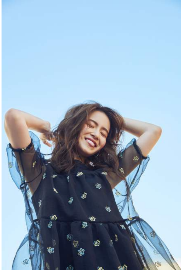
Dress 42,000yen + Tax / AVERY ROW x JOIÉVE