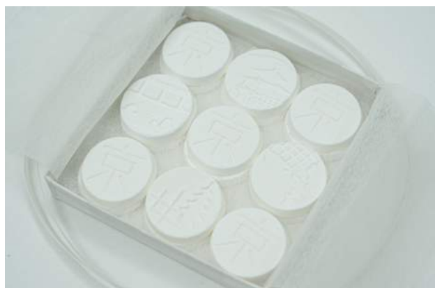
京都の御菓子司「亀屋則克」と コラボレーションした干菓子 1,500円