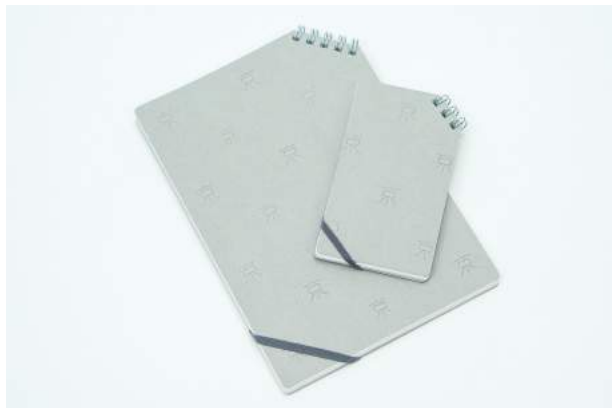
A5サイズリングノート 1,300円 リングメモ 900円