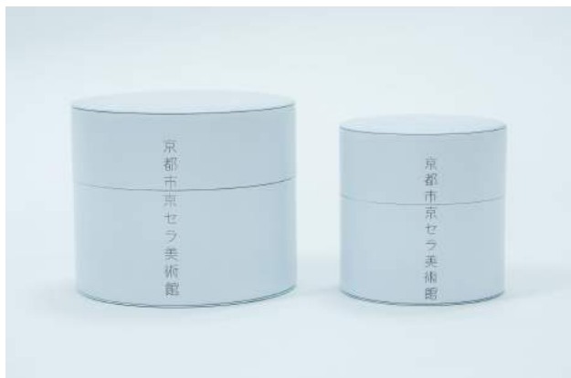
缶（茶筒） 大 1,800円 小 1,200円