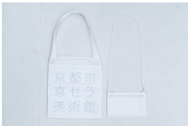
バッグ 3,500円 サコッシュ 2,500円