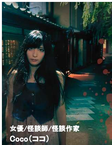
女優/怪談師/怪談作家 Coco(ココ)