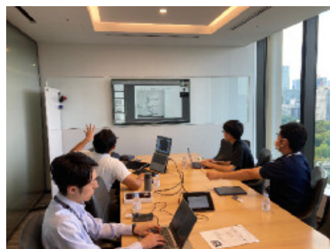
トラック広告の事業計画に関する ディスカッション 株式会社 Essen