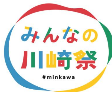
みんなの川崎祭ロゴマーク

・カワサキ文化会館（川崎区駅前本町 21-12 川崎第 3 京急ビル）13:00～17:00