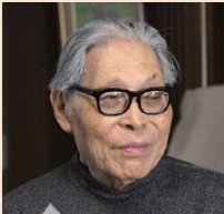
かこさとし さん (1926～2018)

日本を代表する絵本作家の一人。現在の福井県越前市生まれ。就職を機に川崎市幸区に転居。企業に勤めながら休日はセツルメント活動に励み、活動の一環として紙芝居等を創作。その後、絵本作家となり、菊池寛賞など数々の賞を受賞。代表作『からすのパンやさん』、『だるまちゃんシリーズ』をはじめ、600点余りの作品を出版した。