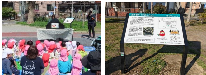
【活動紹介プレートお披露目イベント】