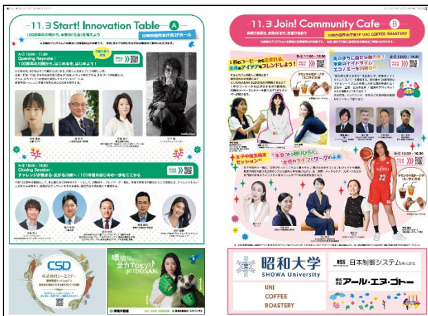
【6・7面】→ 「Colors,Future!Summit 2024」 カンファレンスC会場のセッション紹介と、 ラゾーナ川崎プラザ ルーフ広場にて 開催するフェスティバルの出店紹介①