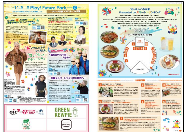
←【8・9面】 「Colors,Future!Summit 2024」 ラゾーナ川崎プラザ ルーフ広場にて開催 するフェスティバルの出店紹介② 同時期に開催する「全国都市緑化かわさ きフェア」富士見公園会場と 「Block Party #044409」の紹介