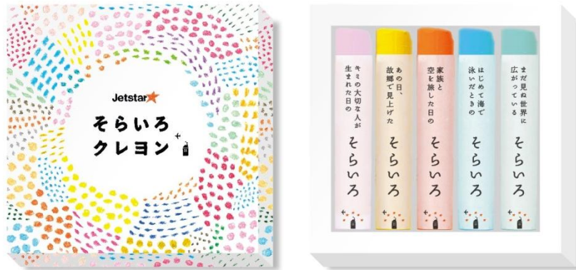
< ジェットスターそらいろクレヨンセット イメージ> 販売用 価格:¥850(税込) ※沖縄(那覇)のみ販売なし