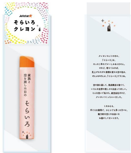
< ジェットスターそらいろクレヨン イメージ >