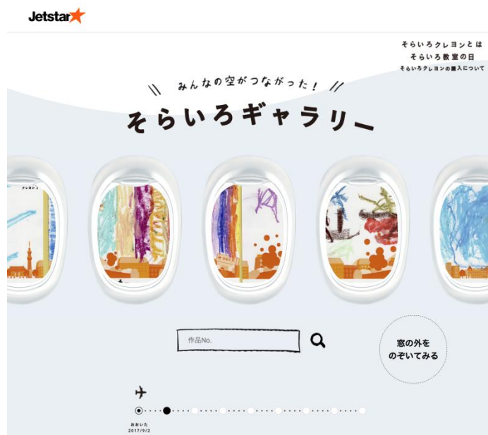
< ジェットスターそらいろクレヨンギャラリー イメージ >

URL: http://campaign.jetstar.com/sorairo/