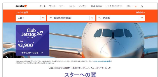
Club Jetstar トップページ