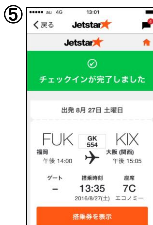
チェックイン完了画面