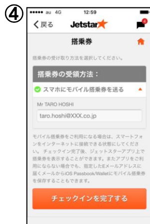
搭乗券の受取り方法を選択