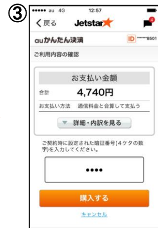
お支払い金額を確認して購入