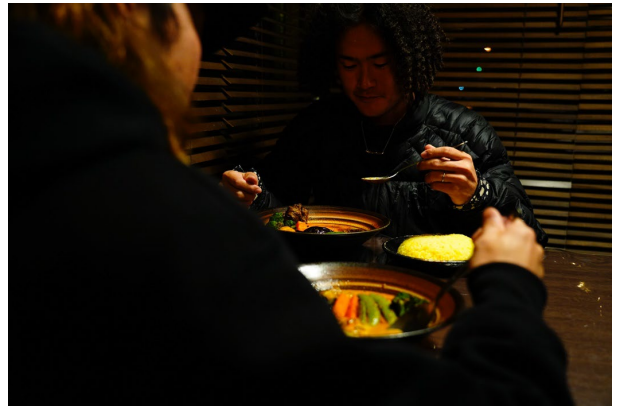
お互いを高め合いながらスノーボードを楽しむライダー。