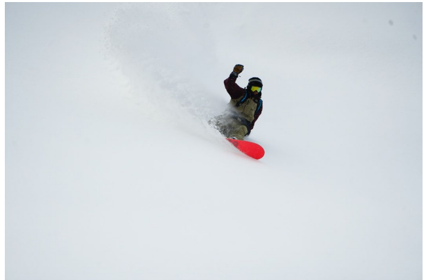
バックカントリーエリアで映像をチェック。