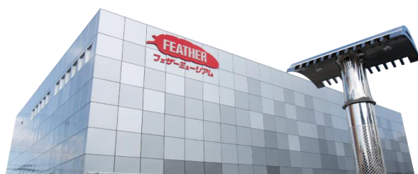
フェザーミュージアム https://www.feather-museum.com/

当社の技術力の高さは、世界初の刃物総合博物館「フェザーミュージアム」にてご覧いただけます。