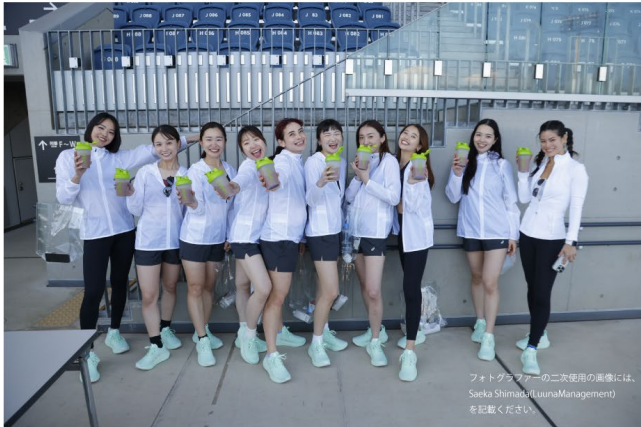
フォトグラファーの二次使用の画像には、Saeka Shimada(LuusaManagement)を記載ください。