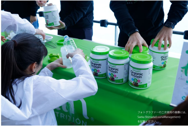
フォトグラファーの二次使用の画像には、Saeka Shimada(LuusaManagement)を記載ください。