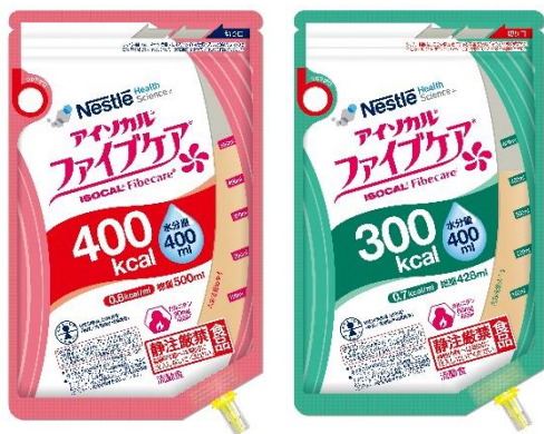
マルチなファイバーブレンド流動食 「アイソカルファイブケア」

ネスレヘルスサイエンスは、高齢化に伴う疾患などにより通常の食事で十分な栄養を摂ることが困難な方々の課題に対して、「アイソカルファイブケア」や「アイソカルサポート1.5 Bag」などの病者用食品「総合栄養食品」を開発・販売し、栄養不足の解消や健康維持に貢献していきます。