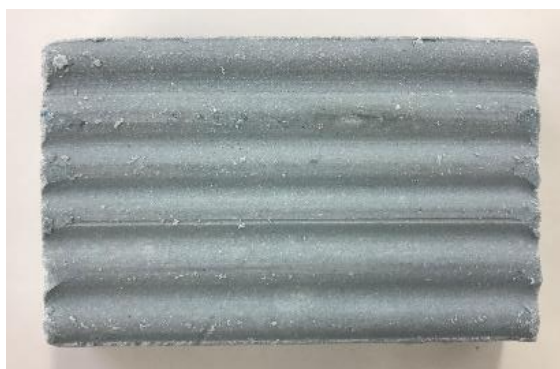
＜ランドリースクラバー 表面＞

洗たく板のような凹凸の面がお洗たくの際に空気を含むことで、従来品に比べて約1.5倍の泡立ちの良さを実現するなど、泡自体もきめ細やかな質の高いものとなっています。