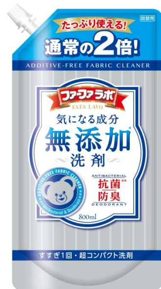
ファーフアラボ無添加*超コンパクト液体洗剤