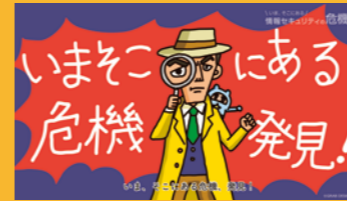
情報セキュリティ講座 入門編