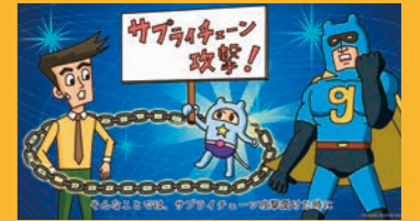
情報セキュリティ講座 手口解説編

●実行ファイル(exe)はなぜ危険なの? ●ファイル偽装の手口を知ろう ●マルウェアって何? ●APT攻撃って何? ●ランサムウェアって何? ●アップデートしないとうなるの? ●ゼロデイ攻撃って何? 視聴時間 14分 / 理解度テスト付 日本語 / 英語