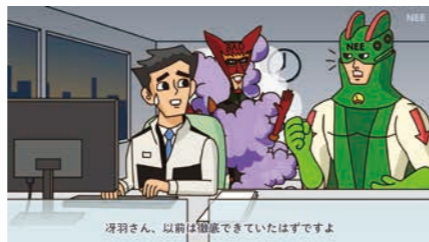
深羽さん、以前は間違えていたはずですよ