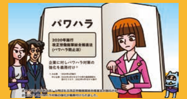
ハラスメント防止講座

●労働時間を守ろう! ●反社会的勢力と関わるな! ●無断で使ったら著作権侵害! ●プライベートでも会社の一員! ●パワハラ・セクハラ境界線 ●下請け業者を大切に! ●贈り物? 賄賂? 贈収賄に気を付けよう ●小さな嘘が虚偽申請に! 視聴時間 30分 / 理解度テスト付