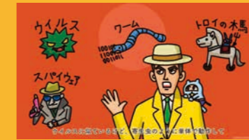
情報セキュリティ講座 サイバー編

●機密情報の覗き見・盗み聞きに注意! ●外出先ではスマートフォン・パソコンの紛失・盗難に注意! ●ID・パスワードは貴重品のように管理! ●安易に添付ファイルやURLは開かない! ●SNS上で仕事の話や愚ふざけの投稿をしない! ●許可されていない外部記憶媒体をパソコンに接続しない! ●公衆Wi-Fiの危険性を理解しよう! 視聴時間 35分 / 理解度テスト付 日本語 / 英語