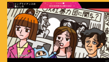
コンプライアンス講座

●あなたにも関係する個人情報保護 ●個人情報って何? ●個人情報取扱事業者とは ●個人情報利用の基本ルール ●個人情報の第三者への提供(オプトイン) ●個人情報の安全管理措置とは ●匿名加工情報と仮名加工情報 ●個人情報の漏えい事故を防止しよう! 視聴時間 36分 / 理解度テスト付