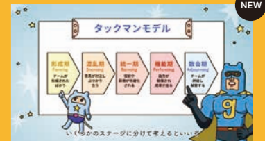
チームビルディング講座

●セルフワークを意識してみよう ●目的を意識しよう ●自分の良さを再発見しよう ●嫌いな自分から抜け出す方法 ●自分を勇気づけよう 学習時間 120分 / インタラクティブワーク