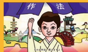
ビジネスマナー講座