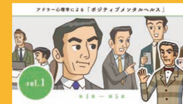
メンタルヘルス講座

【社内編】 ●服装・挨拶の仕方 ●就業についての心構え ●ほうれんそう ●業務指示の受け方 ●電話応対 ●名刺交換 ●会議の参加 ●メールの書き方 ●ビジネスライティング(報告書・企画書等) 【社外編】 ●クライアント訪問時のマナー ●タクシー・エレベーター・電車の乗り方 ●接待・飲み会の参加 ●食事のマナー ●クレーム・謝罪の対応 ●ソーシャルメディアのルール