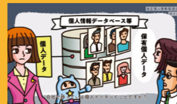
個人情報保護法講座