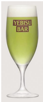
翡翠美人 : 600 円 (アビスビール+キウイ)

また、アビスビールで作った特製ビヤカクテル「翡翠美人」「琥珀美人」も販売します。見た目が華やかで飲みやすく、人気の商品です。