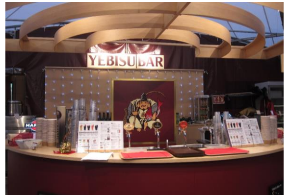
昨年のテント内カウンター

YEBISU BAR 光のページェント店は、大型テントブースで営業するスタンディング形式です。「エビスをゆっくり味わう」「大切な人と過ごす」「仲間と語らう」「自分へのご褒美の場所」など、訪れるお客様一人ひとりが寛げる空間を提供します。