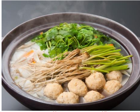
鶏団子入り せり鍋 : 500 円