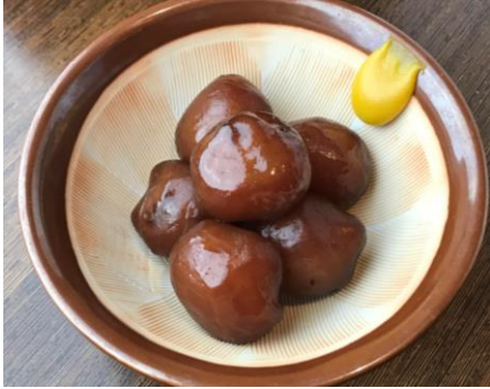
玉こんにゃく : 300 円