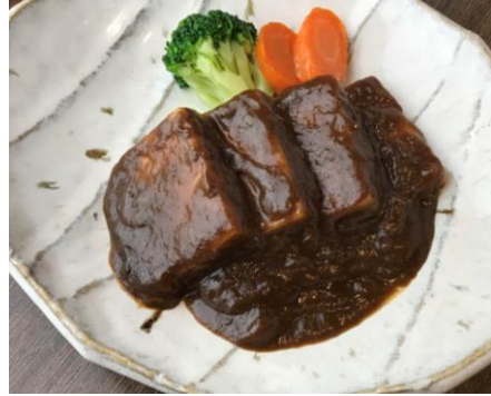
宮城野ポークのビール煮 : 1,000 円