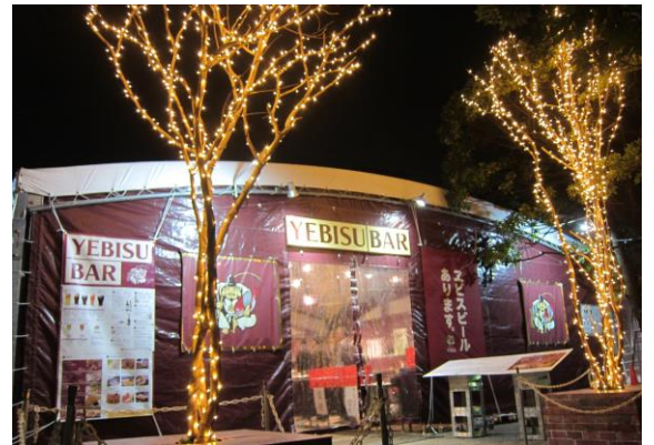
昨年の大型テントの外観

なお、グループ会社であるサッポロホールディングス株式会社は、本年も東北全体の復興を願い、9月に東京で開催した「恵比寿麦酒祭り」での生ビールの売上金相当額の一部を、「光のページェント」で使用するLED電球の購入資金の一部として、11月27日(月)に寄付金を贈呈させていただきました。