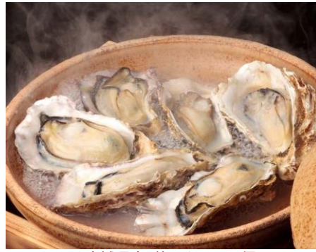
宮城県産 蒸しカキ : 1 個 300 円