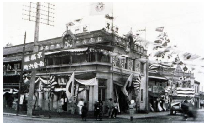
日本初のビヤホール「恵比壽ビヤホール」

日本酒（上等酒）1升25銭3厘であり、ビールはまだ高級な時代でしたが、このビヤホールは非常に繁盛し、何時でも満員御礼、毎日売切れの立札をするほどで、1日の来客数は平均800人に達しました。遠方から馬車でやってくる人もいたそうです。