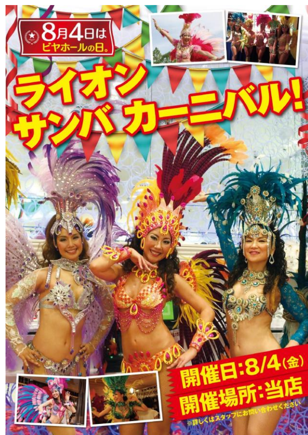
ライオン サンバ カーニバル イメージ

【スケジュール】8月4日（金）※時間は変更する場合がございます 17:30 ビヤホールライオン 銀座七丁目店 19:30 銀座ライオン GINZA PLACE 店 21:30 ビヤホールライオン 銀座七丁目店