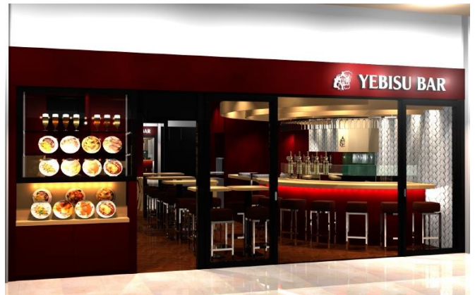
※外観イメージパース

なお「YEBISU BAR」は現在、全国18店舗を展開しており、今回の横浜市初出店である「キュービックプラザ新横浜店」を含めると19店舗となります。