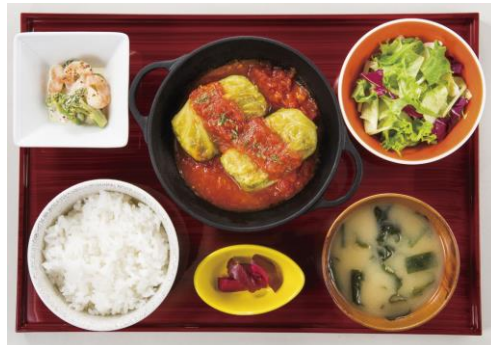
ロールキャベツ御膳

キュービックプラザ新横浜店限定のランチメニューエビス様の「福御膳」をご用意します。女性も男性にも喜ばれるように、メインを選べるようにし、おかずも豊富な御膳ランチです。