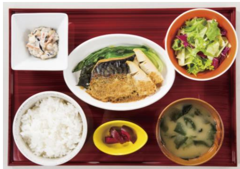
サバのごま味噌焼き御膳