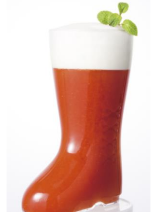
横浜レッドアイ ～小さな赤い長靴～