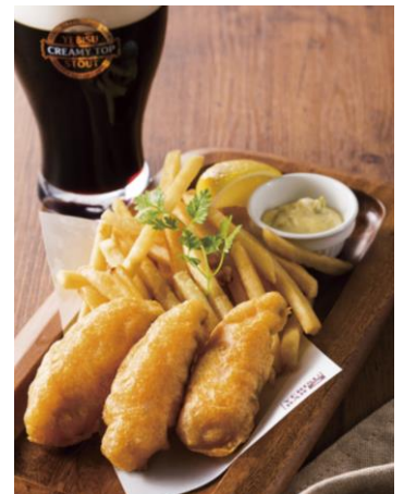
真鯛のフィッシュ&チップス (972円)