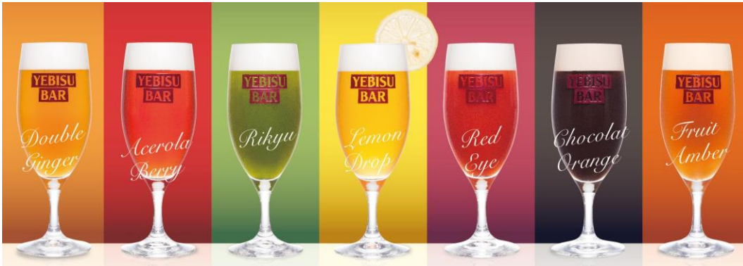
ビヤカクテルイメージ

またキュービックプラザ新横浜店では、新たに横浜の名物になるような、横浜が舞台の童謡をイメージした限定ビヤカクテル「横浜レッドアイ～小さな赤い長靴～」(648円)をご用意します。エビス生ビールにトマトピューレとライチのリキュールをまぜあわせたレッドアイをかわいらしいブーツグラスで提供します。甘く香りの良い味わいのため、おしゃれな横浜の街にピッタリの商品です。