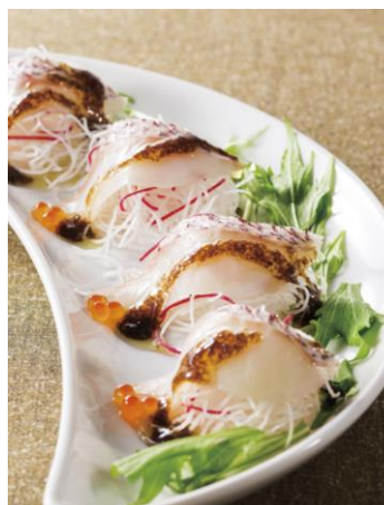
真鯛のカルパッチョ 昆布のソース (972円)

また、樽生エビスの全ラインアップを取り揃え、表情豊かな各エビスの個性をより楽しんでいただくため“エビスと料理のマリアージュ”をメニューコンセプトに据え、それぞれの特徴に合わせた料理を提供しています。メニューブック上でも、各エビスのアイコンがつけられ、マリアージュを分かりやすく提案しています。