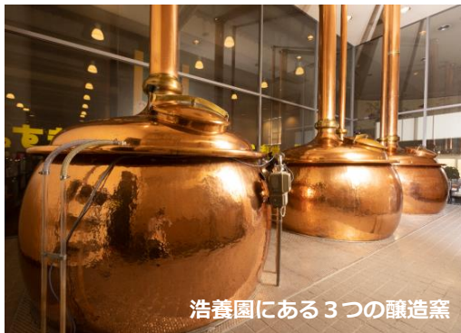
浩養園にある3つの醸造窯