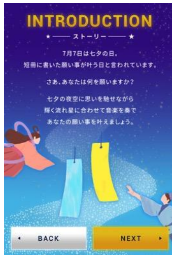
セタストーリー 画面イメージ