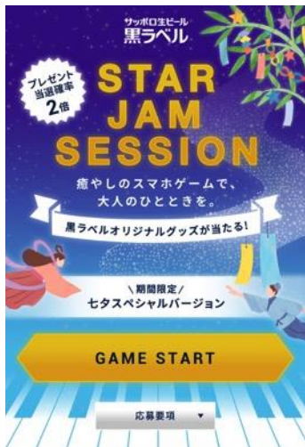
トップ 画面イメージ