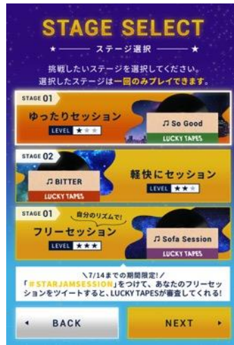
ステージ選択 画面イメージ