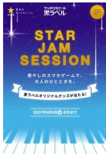
トップ 画面イメージ