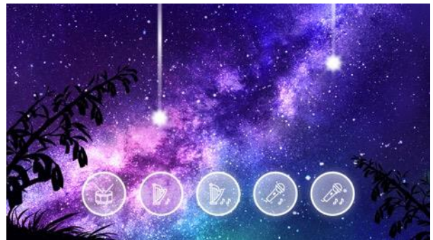
プレイ画面イメージ (3ステージ共通)