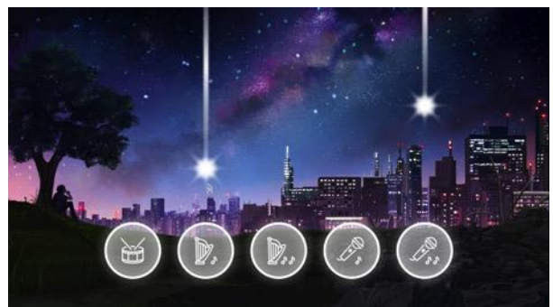
ゆったりセッションステージ プレイ画面イメージ