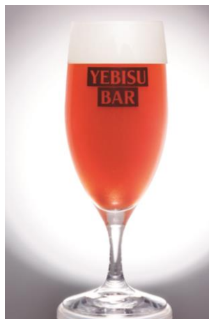
静岡レッドアイ 紅富士 680円