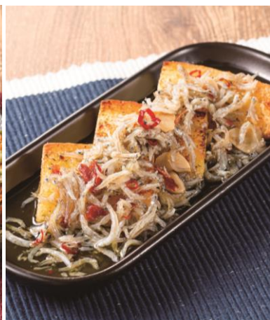
ごぼれしらすの ガーリックトースト 650円