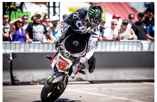
スタントバイクイメージ