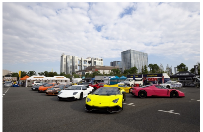
総額20億のスーパーカー展示(例)