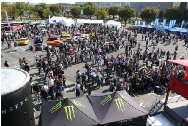
出展ブースエリアイメージ