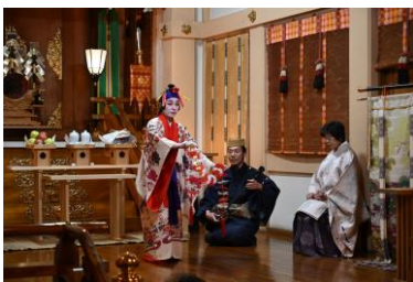
青山熊野神社での奉納神事