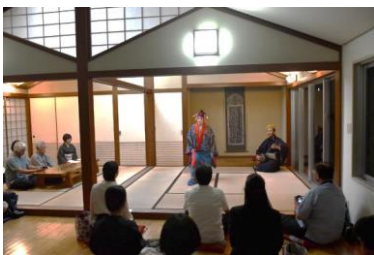
「琉球の美」 琉球伝統芸能と松山御殿の宮廷料理