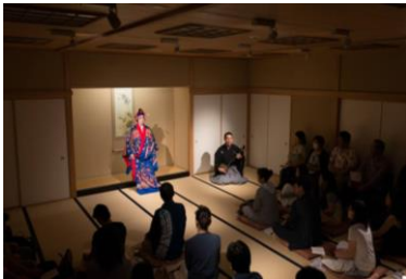
「美の世界」 大劇場では味わえない臨場感