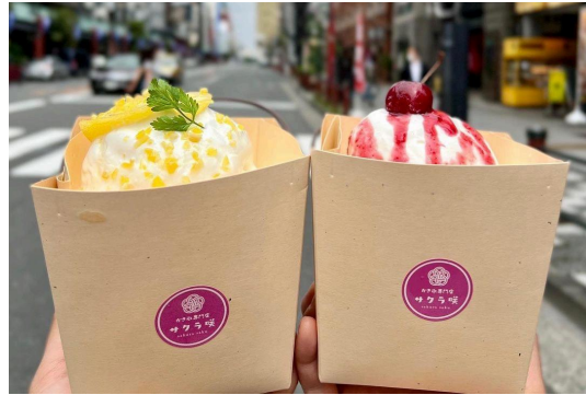
人気のオシャレかき氷を人力車ドライブスルーで