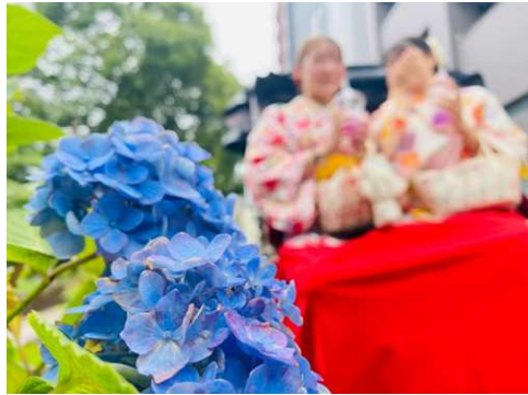
和装で浅草に溶け込むリアル没入体験！ いつもより高い目線であじさいを楽しめます

人力車を引く俵夫（しゃぶ）に観光ガイドとカメラマンをお任せいただけるので、お連れ様とご一緒にあじさいフォトを撮ることもでき、タイムパフォーマンスの良いレジャーをお楽しみいただけます。また、かき氷は人力車でのドライブスルーで、いつもより高く眺めの良い状態でお召し上がりいただけます。