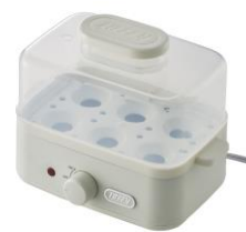
アッシュホワイト K-FS2-AW